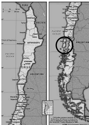
FIGURA 1: Mapa de las costas Sur-Australes de Chile